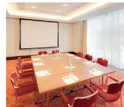
Altes Land I