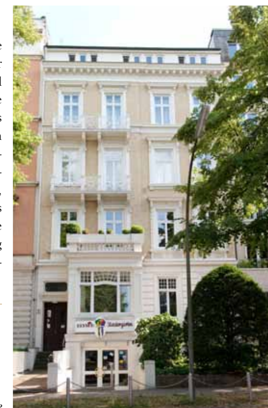
Die Villa ist fest in das Hotelleben integriert The villa has been fully integrated into the hotel