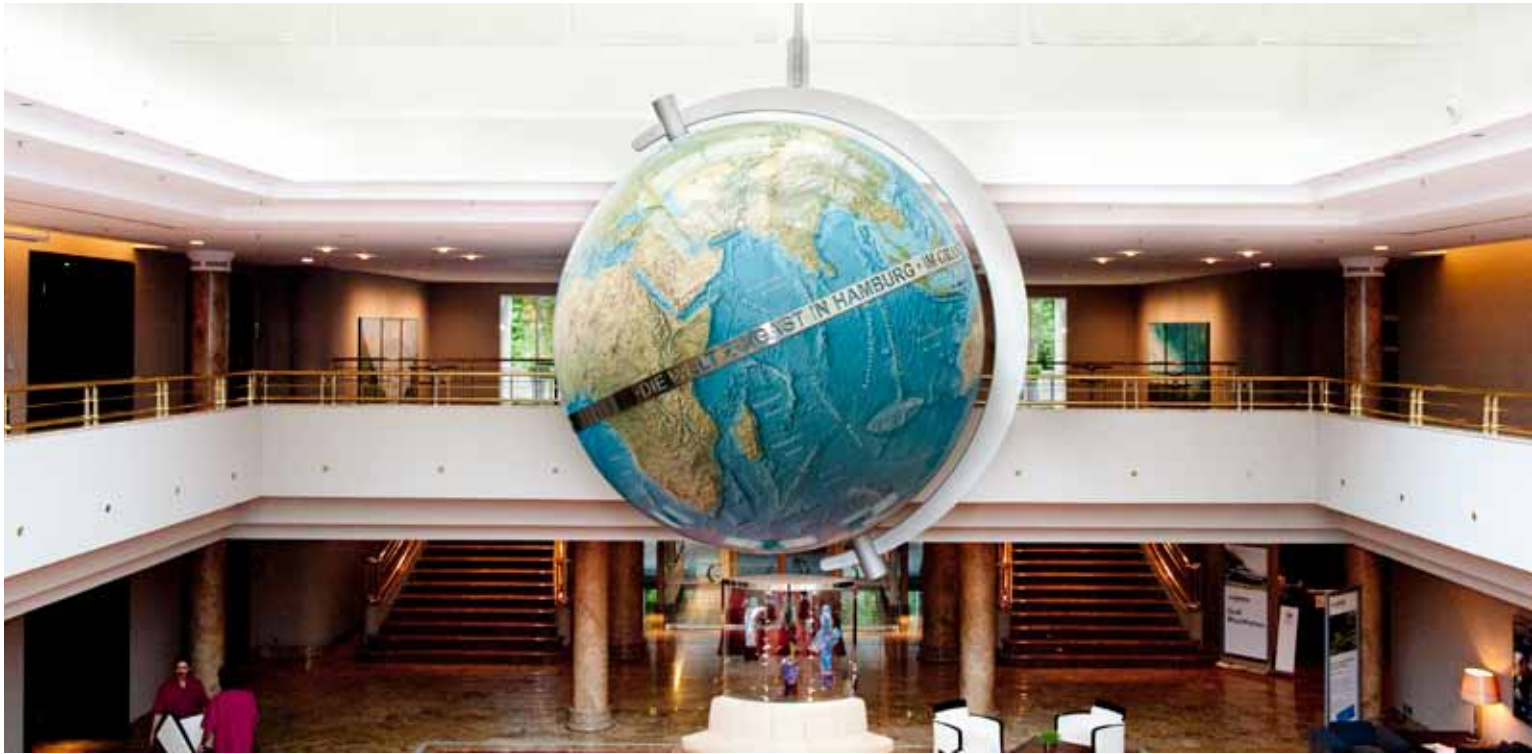
Ein strahlender Globus ist der neue Hingucker im Grand Foyer The large globe the new eye catcher in the Grand Foyer