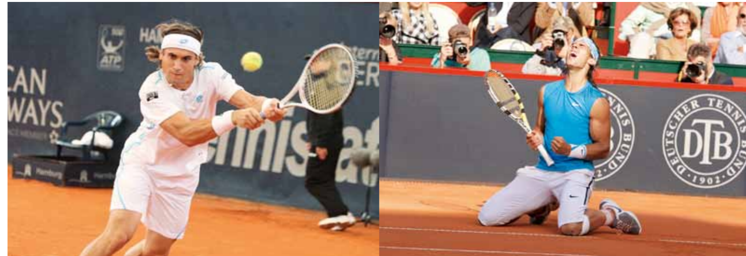
David Ferrer (links) und Rafael Nadal (rechts) schlugen bereits in Deutschlands größtem Tennisstadion auf

bles the fish to mature gently. Herrings are not only healthy but trendy. For example in the Brasserie at the Grand Elysée they are served with an onion and ginger vinaigrette on a bed of fine asparagus. Served traditionally, properly filleted and artistically put on the plate – here is your Sashimi of the North. •