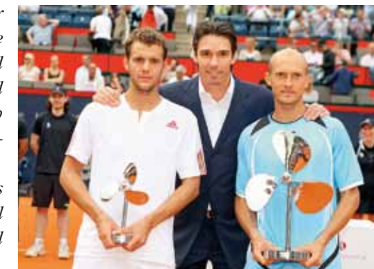
Tournament director Michael Stich with finalist in 2009 P.-H. Mathieu (left) and winner Nikolay Davydenko (right)

On 21 st of July the traditional Players Night with about 300 invited guests will be celebrated at the hotel. Play, Set and Match at Hamburger Rothenbaum! •