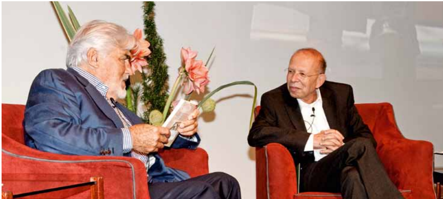
Zwei Weltbürger im Gespräch: Mario Adorf und Rafael Seligmann Two global citizens in conversation