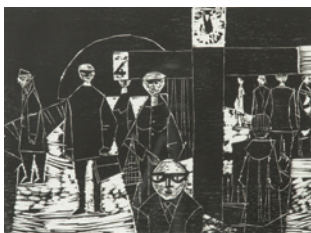
2. Etage „Kunst der Grafik“ Volker Detlef Heydorn Fahrgäste an Bahnsteig 4 1962

Ein Großteil der Sammlung Block wird in Themenausstellungen in den Fluren der Etagen präsentiert, die für jedermann zugänglich sind.