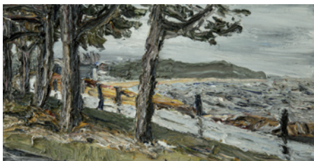
4. Etage „Norddeutsche Realisten“ Christopher Lehmpfuhl Ostsee im Regen 2007