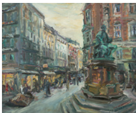
6. Etage „Hamburg-Flur“ André Krigar Gänsemarkt 1997