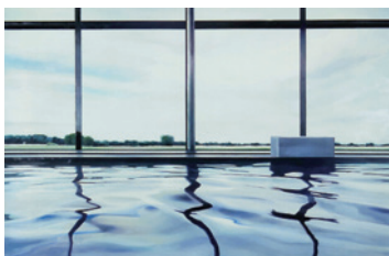
5. Etage „Elysée-Preis für Malerei“ Jutta Haeckel o.T. 2002